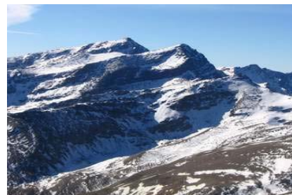
Mulhacén y Alcazaba

Allí arriba nos tomamos el bocadillo, disfrutando de un día soleado, una temperatura espléndida y, como en un balcón, sin poder retirar la vista del espectáculo que formaban La Alcazaba, Calderetas y Vacares, con el Mulhacén asomando por detrás, con un manto blanquinegro cubriéndolos. Tal grandiosidad te reconfortaba física y espiritualmente.