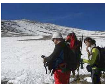
Con el Cerro Pelao al fondo

Pasada la Piedra de Los Ladrones pudimos sentir la nieve bajo nuestros pies, aunque teníamos claro que no íbamos a utilizar los