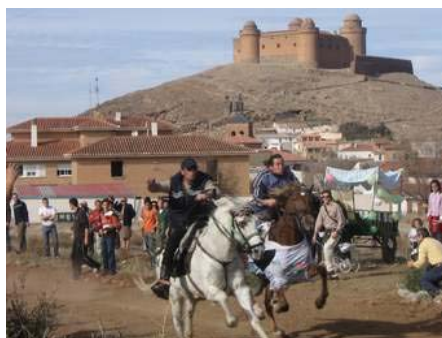
Carreras en La Calahorra

El siguiente pueblo fue La Calahorra, famosa por su bonito castillo, encontrándonos con unas peculiares fiestas, consistente en carreras de caballos entre los lugareños, y que presenciamos. A estas alturas se nos estaba poniendo ya cara de guiris.