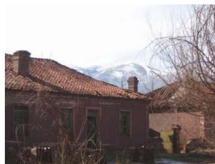
Casas del pueblo minero

Alquife, y en concreto el barrio minero, que acogía en sus años a la población trabajadora en las minas de hierro, y hoy en situación de abandono. Hicimos el recorrido a pie durante un buen rato, y nos impresionó a todos su color rojo y aspecto fantasmal, aunque no pudimos visitar las minas, pues un señor muy amable nos indicó que había llegado la hora de cierre, y que abandonáramos las instalaciones de forma inmediata, pues estábamos en una propiedad privada.